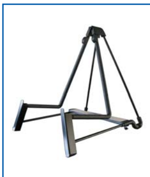
Supporto per sostegno verticale