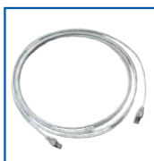
Set di cavi di prova