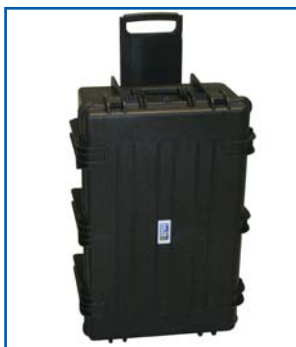
Valigia rigida di trasporto